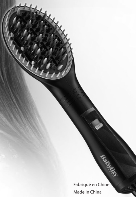
Fabriqu  en Chine Made in China

Tag ledningen ud af stikkontakten, og lad apparatet køle helt af, før det rengøres eller lægges på plads. Vi anbefaler, at børsten rengøres regelmæssigt for at undgå ansamling af hår, frisørprodukter osv. Brug en kam til at fjerne hår fra børsten. Brug en tør eller meget let fugtet klud til plastikoverfladerne.