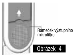
Rámeček výstupního mikrofiltru